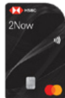
Tarjeta de Crédito HSBC 2Now