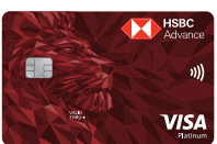
HSBC Advance Platinum Credit Card