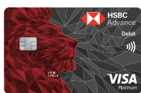
HSBC Advance Platinum Debit Card